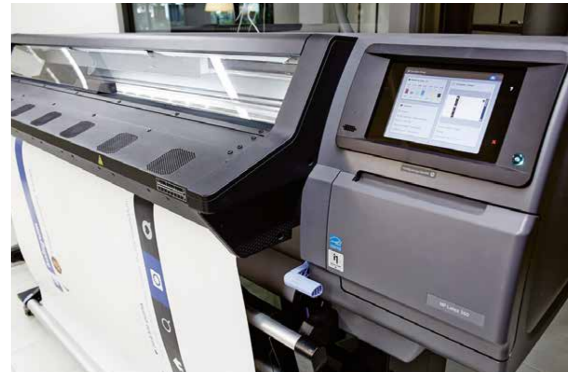
Sistemas de impresión de última generación