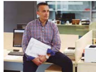
Más de 575 m 2 a su servicio