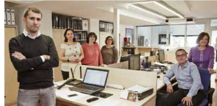
Nuestro recurso más importante: las personas